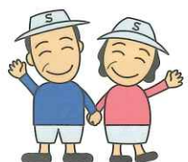
埼玉県シルバー人材センター連合マスコット いきいきさん はつらつさん

公益社団法人 深谷市シルバー人材センター 〒366-0801 深谷市上野台 2567 番地 TEL.048-573-3345 FAX.048-571-7767