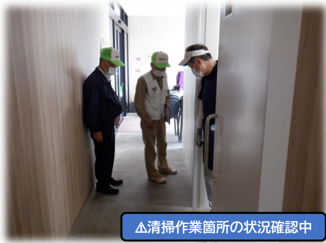
△清掃作業箇所の状況確認中

会員の皆様におかれましては、今後とも安全に就業していただくようお願いいたします。